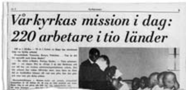
Utdrag ur Kyrkpressen nummer 1 år 1970.

Då man i missionsarbetets barndom åkte ut för att kanske aldrig mera återvända till hemlandet kan man i dag tänka sig att göra sin tre månaders studiepraktik på missionsfältet.