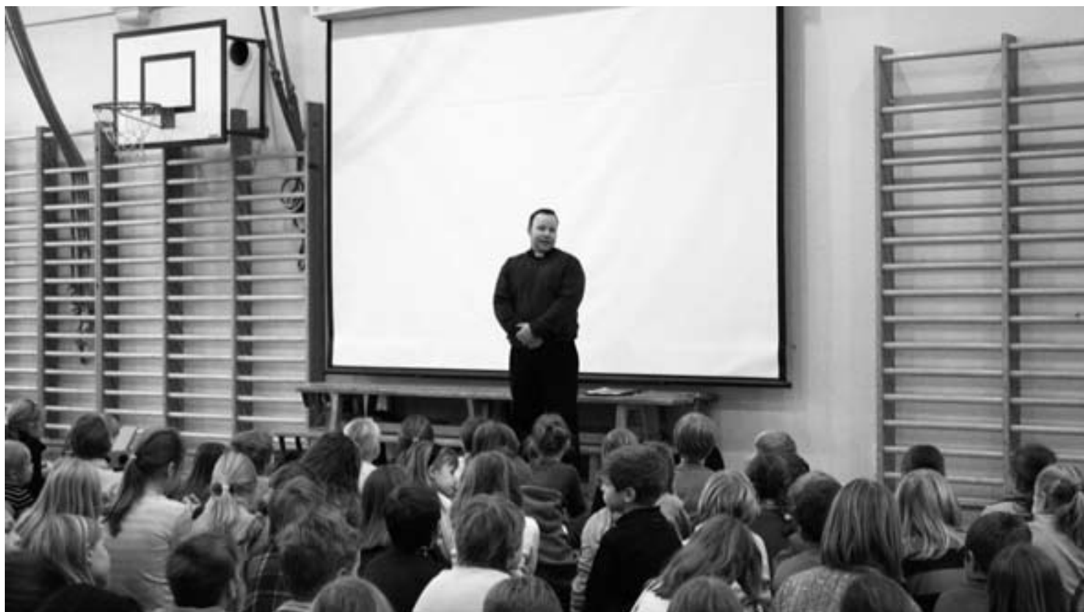
Skolans undervisning i religion är inte religionsutövning. Också andakter och gudstjänster går an i skolan. Det är personalens sak att se till att ingen blir tvungen att "utöva religion" mot sin övertygelse.

Religionsundervisningen bygger på rätt grund