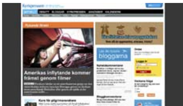
Så här ser ingångssidan till Kyrkpressens webbsidor ut efter att ha genomgått en ansiktslyftning.

Mängden artiklar på Kyrkpressen.fi är massiv. Bloggare och redaktörer har tillsammans producerat cirka 25 000 inlägg, och 65 000 kommentarer. Google har indexerat cirka 380 000 urlar eller webbadresser på kyrkpressen.fi. Siffran kan jämföras med exempelvis hbl.fi som har 70 000 urlar och peppar & papper på sammanlagt cirka 360 000 urlar.