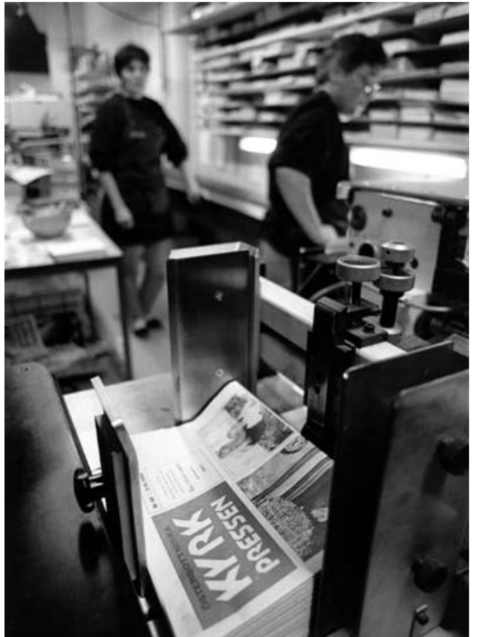
Frams tryckeri satte färg på Kyrkpressen i Vasa. I dag trycks tidningen i Mårtensdal vid Hufvudstadsbladets tryckeri.