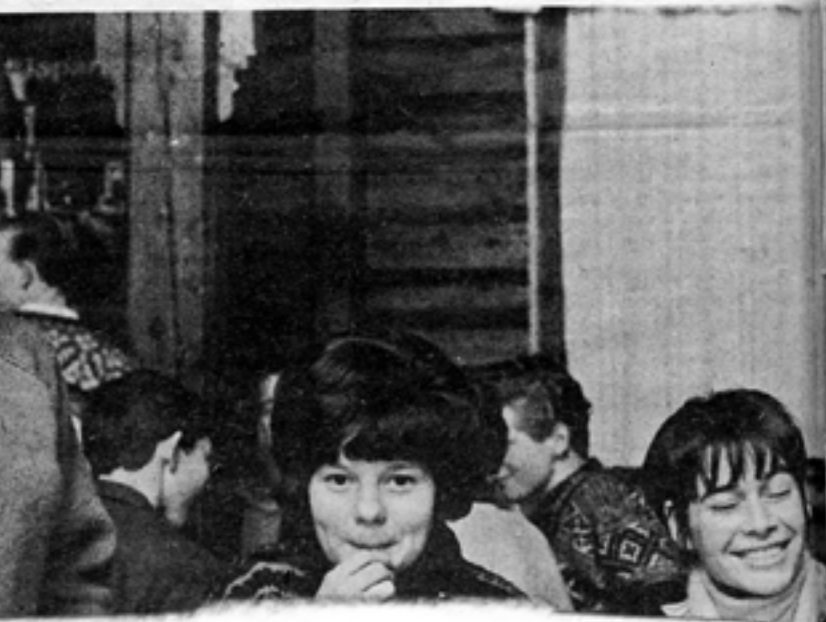
Utdrag ur Kyrkpressen nummer 1 år 1970.

Situationen är i många av- seende förbryllande, säger han. Riksdagen uttalade i samband med ramlagen, att religionsundervis- ningen både utvecklas så att den bättre än hittills skulle motsvara det förändrade samhällets behov. Särskilt borde man läsa utveck- ling vid utbildningen av lärare grundskolans högstadium. Likaså underströk riksdagen, att klass- rare, som på grund av sin överty- gelse inte önskar undervisa i re- ligion, skulle betras. Genom lära- bilda- ning av regionala högstadium. Detta äm- n. Slutligen kan konstateras, att är ett både snidigt och förstärka under- visningen på lägstadiet. Detta blir säkert mycket mer vanligt, sedan Man kan i riksdagens uttalande gälla även för många andra grundskolans högstadium. Slutligen kan konstateras, att är ett både snidigt och förstärka under- visningen på lägstadiet. Detta blir säkert mycket mer vanligt, sedan