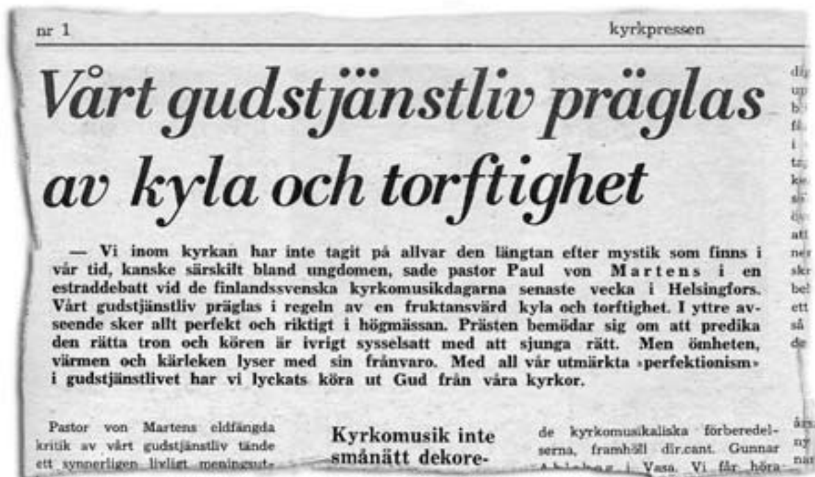
KP nr 1/1970: Vårt gudstjänstliv präglas av kyla och torftighet

"Gudstjänsten är för mig rekreation. Genom syndabekännelse, ordet och nattvarden rekreeras, återskapas, det som gått förlorat i mig. Det är kyrkans viktigaste uppgift att återskapa gudsbilden inom oss."