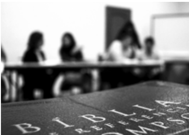
Religionsundervisningen i vår skola uppfyller alla villkor som de internationella fördragen om mänskliga rättigheter och religi- onsfrihet kräver.